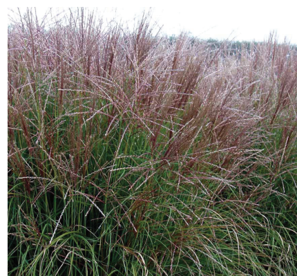
Elefantgræs i regnbed.

Det færdige bed ligger nu ca. 20 cm under terræn og er parat til at blive tilplantet.